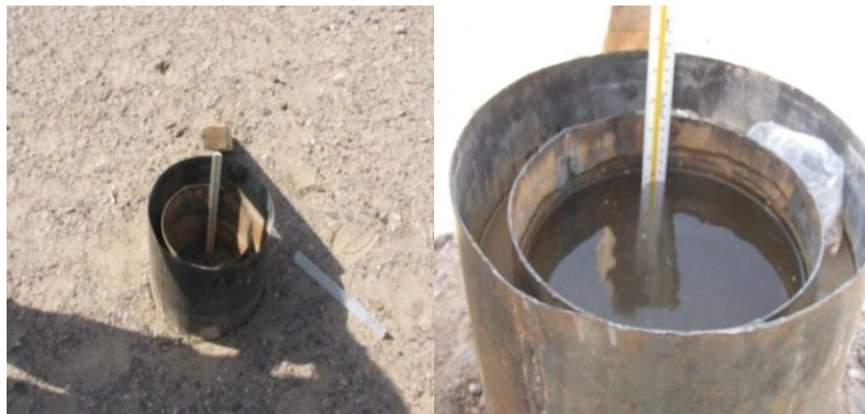
شکل ۲- اندازه‌گیری نفوذپذیری به روش استوانه مضاعف در منطقه

با استفاده از داده‌های حاصل از اندازه‌گیری نفوذ کارایی مدل‌های نفوذ کوستیاکوف، کوستیاکوف-لوییس، هورتون، SCS و فیلپ در برآورد نفوذ تجمعی در عرصه‌های پخش سیلاب بررسی شد. در جدول ۲ مدل‌های نفوذ مورد بررسی و پارامترهای برازش آن‌ها آمده است.