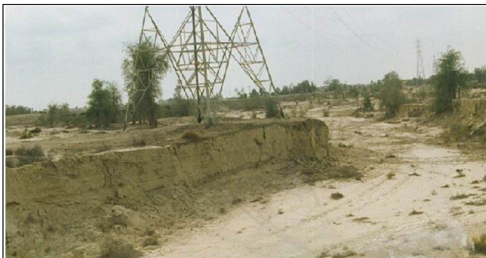
شکل ۳- نمایی از خندق معرف منطقه نالینت