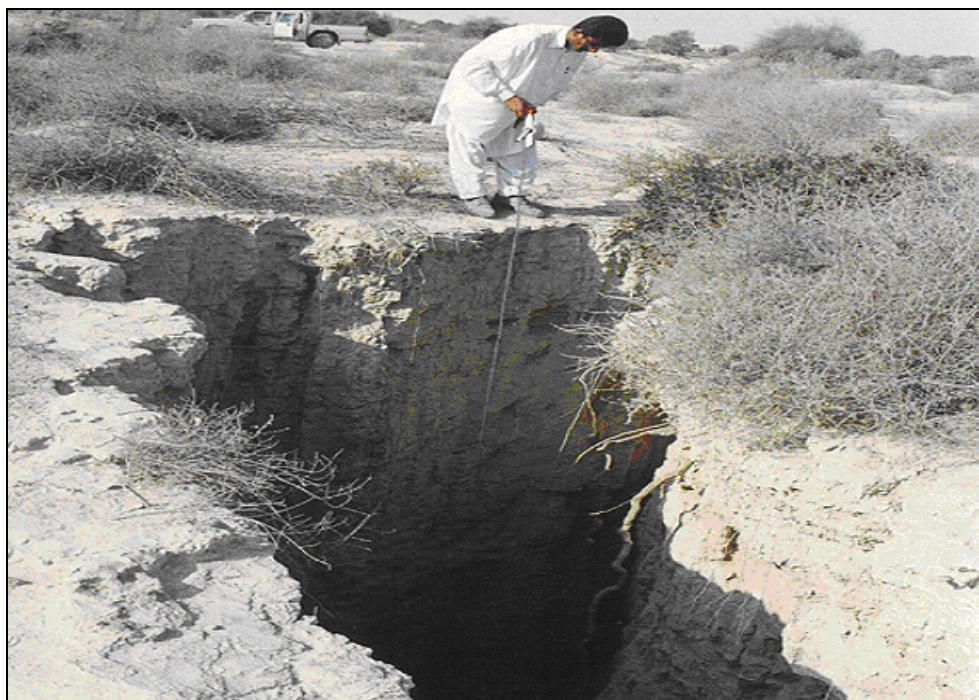
شکل ۴- نمایی از ابتدای خندق حسین زهی