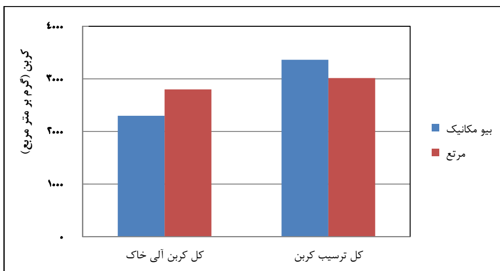
شکل ۴- مقایسه کربن خاک و کل ترسیب کربن