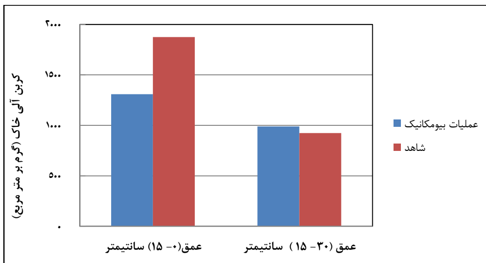
شکل ۲- مقایسه ذخیره کربن آلی خاک در اعماق مختلف عملیات بیومکانیک و شاهد

شکل ۲ کربن آلی خاک را در عملیات بیومکانیک و شاهد در دو عمق مختلف نشان می‌دهد.